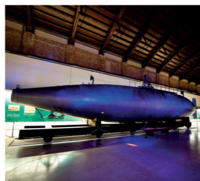
▲ Museo Naval