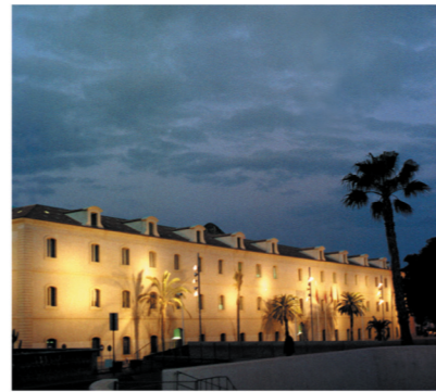
▲ Campus Muralla del Mar