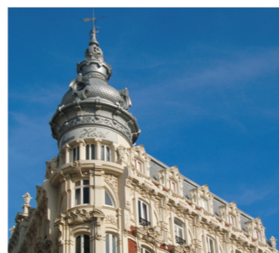
▲ Gran Hotel