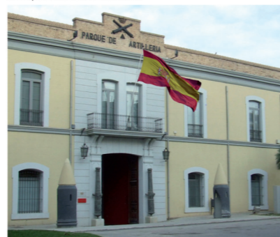
▼ Parque Maestranza de Artillería