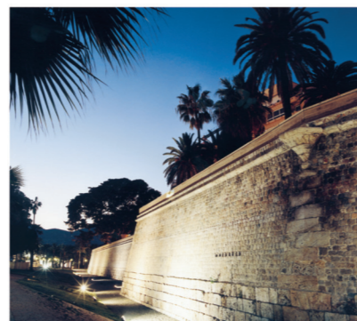
▲ Muralla de Carlos III