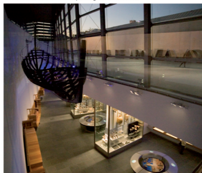
▼ Museo Nacional de Arqueología Subacuática