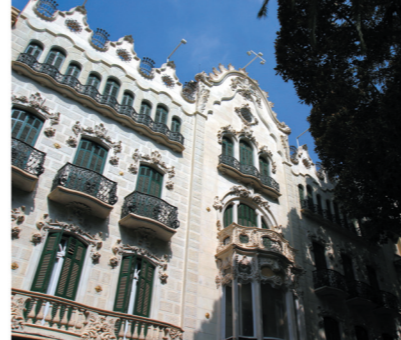
▼ Casa Maestre