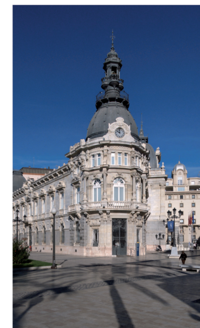
CARTAGENA Plano turístico