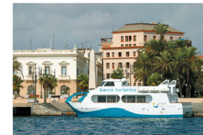
▼ Catamarán turístico