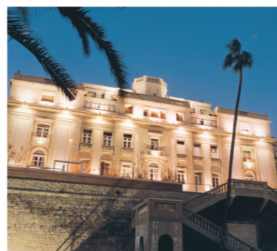
▼ Escuela de Guardiamarinas