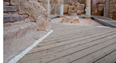
▲ Barrio del Foro Romano