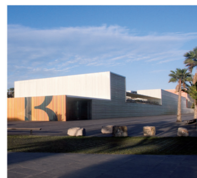
▲ Auditorio y Centro de Congresos El Batel