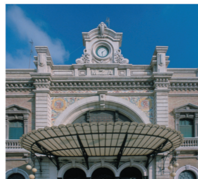
▲ Estación de Ferrocarril