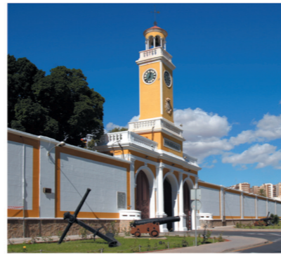
▲ Puerta del Arsenal