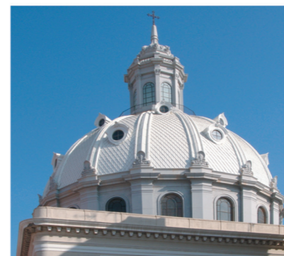
▲ Iglesia de la Caridad