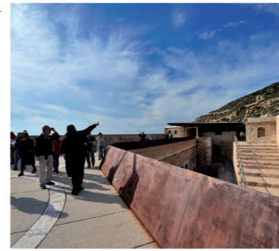
▲ Fuerte de Navidad. Centro de interpretación de la arquitectura defensiva.