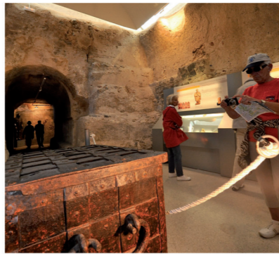
▲ Castillo de la Concepción